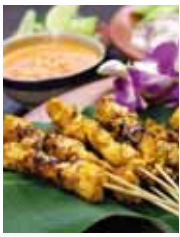
Sate (o Satay)